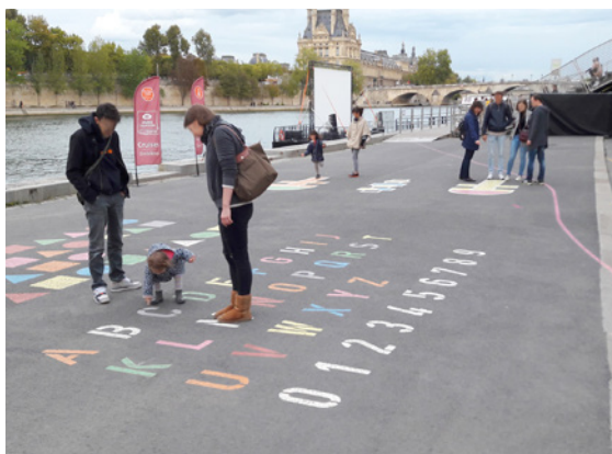
Marelles, abécédaire, formes géométriques...