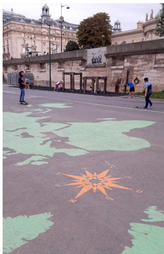
Art urbain : la carte du monde à Paris (75)