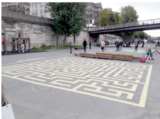
Labyrinthe à Paris (75)

De plus, elle ouvre la possibilité d'offrir des «quasi aires de jeu» au pied des habitations sans aller dans le grand parc le plus proche, permettant des activités de proximité qui peuvent être appréciables pour les familles.