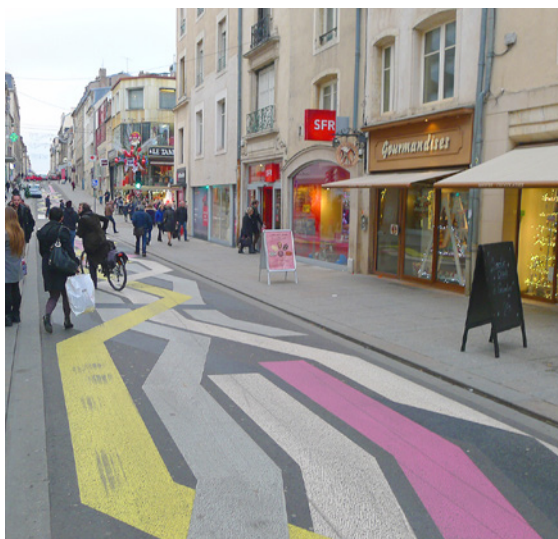
Marquage d'animation à Nancy (54)

Afin de pouvoir signaler aux usagers qu'une aire piétonne ou une zone de rencontre est différente d'une rue classique, sans modifier le profil en travers, donc à des coûts très inférieurs, il est maintenant possible pour les collectivités d'utiliser des marques d'animation.