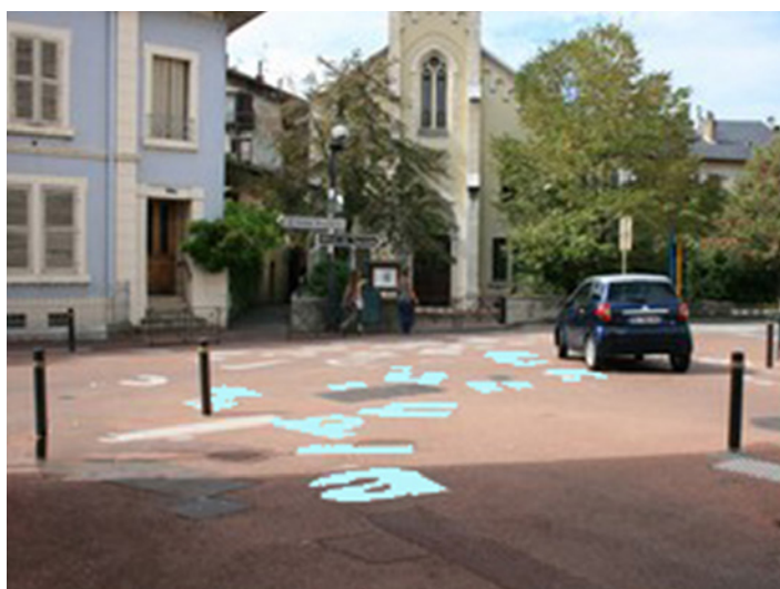
Devant une école à Chambéry (73)