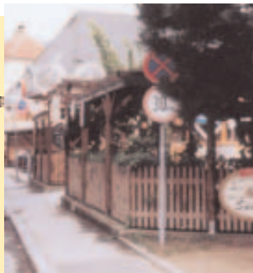
Bistrot vélo, à proximité de la piste du Danube (Autriche)