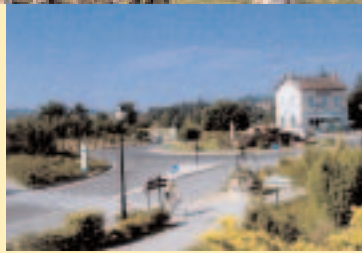
VILLE DE BUXY

Dans le cas de Buxy, différents partenariats ont permis à la commune, dans le cadre du même projet (voir page 2), de réhabiliter aussi l'ancien bar-restaurant de la Gare, d'aménager un giratoire et une piste cyclable reliant le centre-ville à la voie verte concernée (Givry-Cluny)