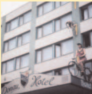
Véritable «hôtel vélo» de plus de 80 chambres ne travaillant pratiquement qu'avec des cyclistes sur la piste du Danube

relais vélo, ils seront à différencier des panneaux d'information concernant la véloroute-voie verte, leurs services et les boucles venant se brancher sur l'itinéraire principal.