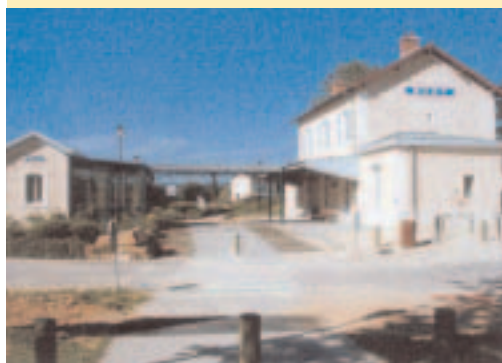
VILLE DE BUXY

A titre d'exemple, l'aménagement d'une voie verte sur une ancienne ligne de chemin de fer (ici à l'initiative du Conseil général de Saône-et-Loire) peut être l'occasion pour différentes communes de s'impliquer dans le projet voie verte et d'aller au delà : comme à Buxy, où la gare délaissée convertie en bibliothèque et en office de tourisme sert aussi de relais secondaire vélo