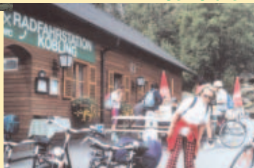
Relais vélo-café restaurant sur la piste du Danube à Köbling, offrant téléphone, sanitaires, douches, point info...